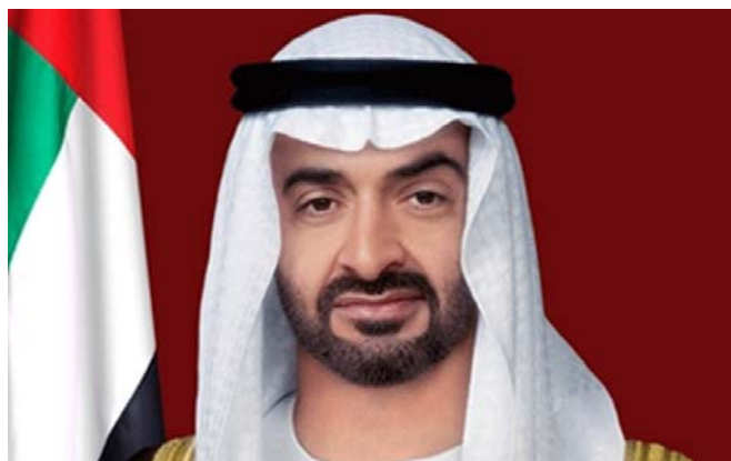
ژنرال شیخ محمد بن زیاد آل نهیان

دوست او اریک پرنس بی‌گمان تنها مجریان طرح‌هایی هستند که مقامات بالای واشینگتن تصمیم می‌گیرند. هدف واقعی او در پرونده‌هایی که نیویورکتایمز منتشر کرده مطرح شده است: ارتشی که در امارات در شرف شکل‌گیری می‌باشد «مأموریت‌های عملیاتی ویژه برای سرکوب شورش‌های داخلی، مشابه به آنچه امسال در جهان عرب به وقوع پیوسته است» دارد.