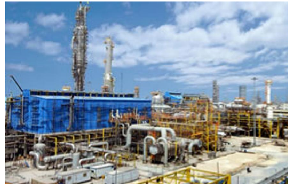
مجتمع پتروشیمی پردیس

این حادثه به دلیل انفجار در حین عملیات جوش کاری خط لوله انتقال گاز اتان در واحد قدیم آمونیاک پتروشیمی پردیس (پردیس یک) ایجاد شده است.